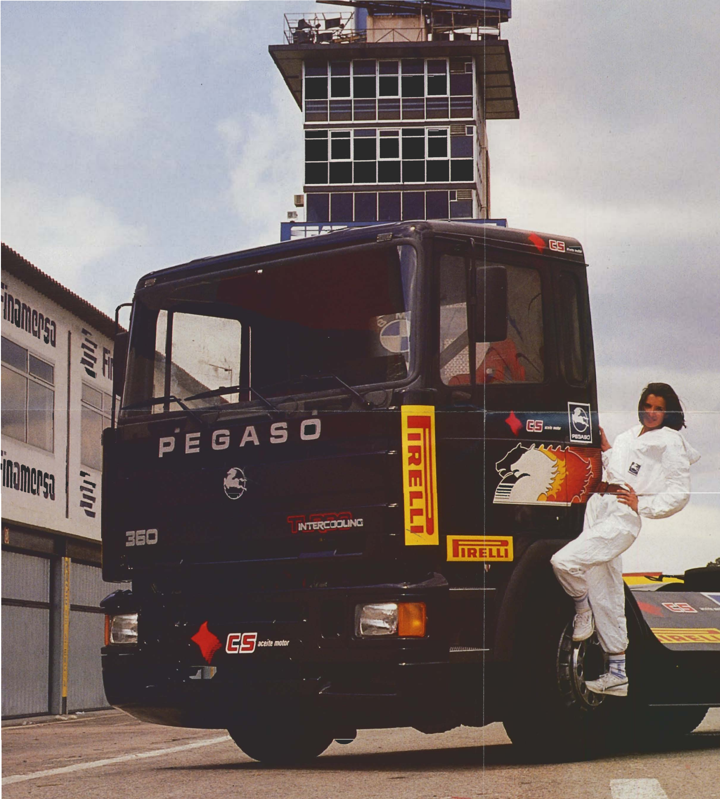
Camión Pegaso de carreras perteneciente al CS-Pegaso Racing Team.