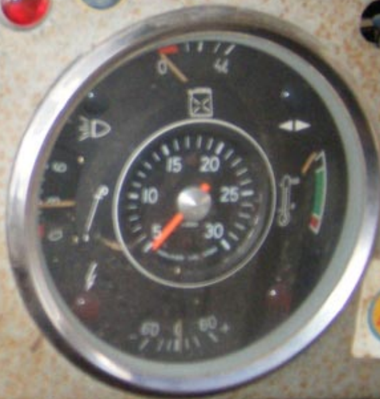
RICARDO PALOMAS archivo pegasoesmicamion