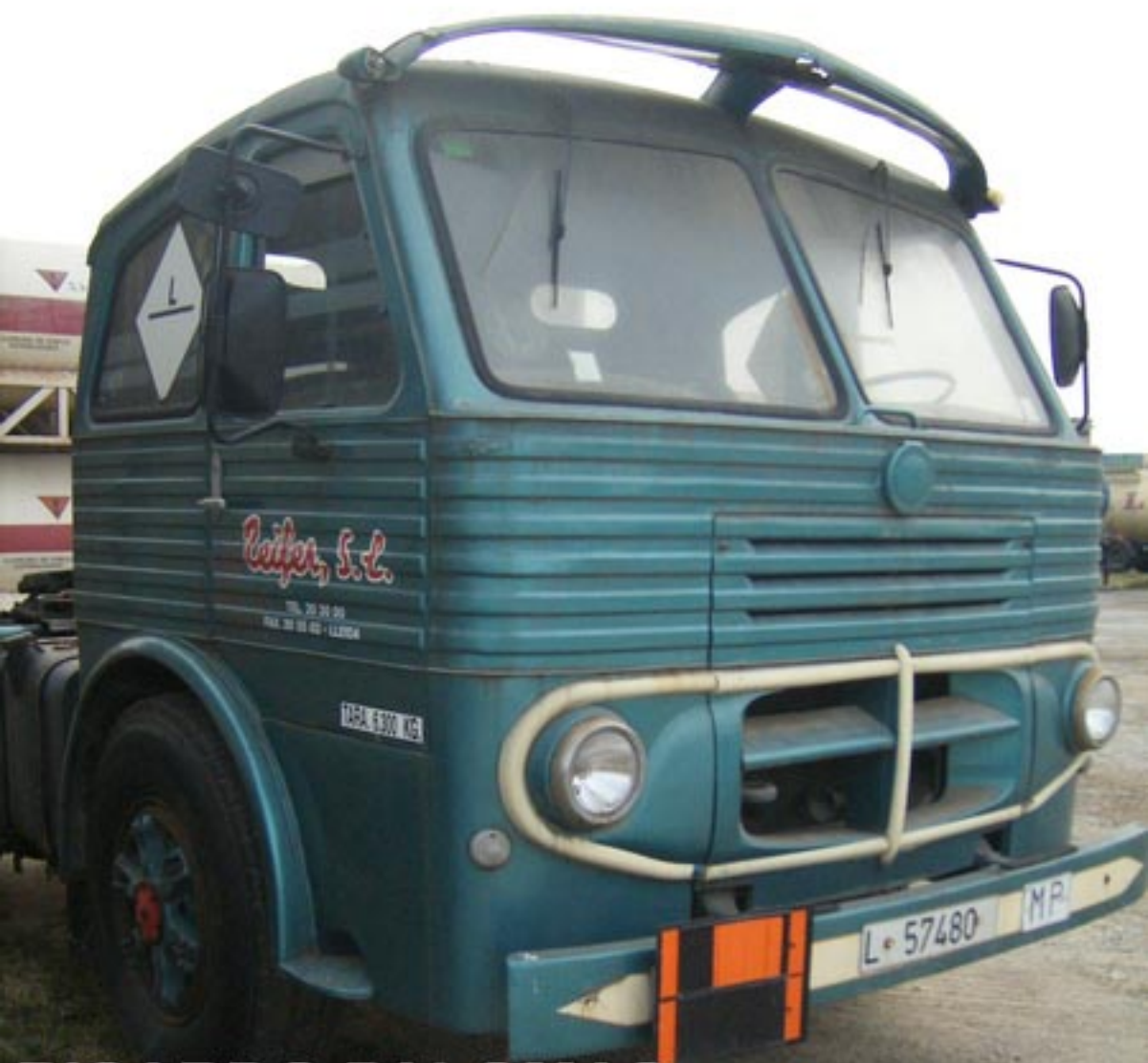
RICARDO PALOMAS archivo pegasoescamion