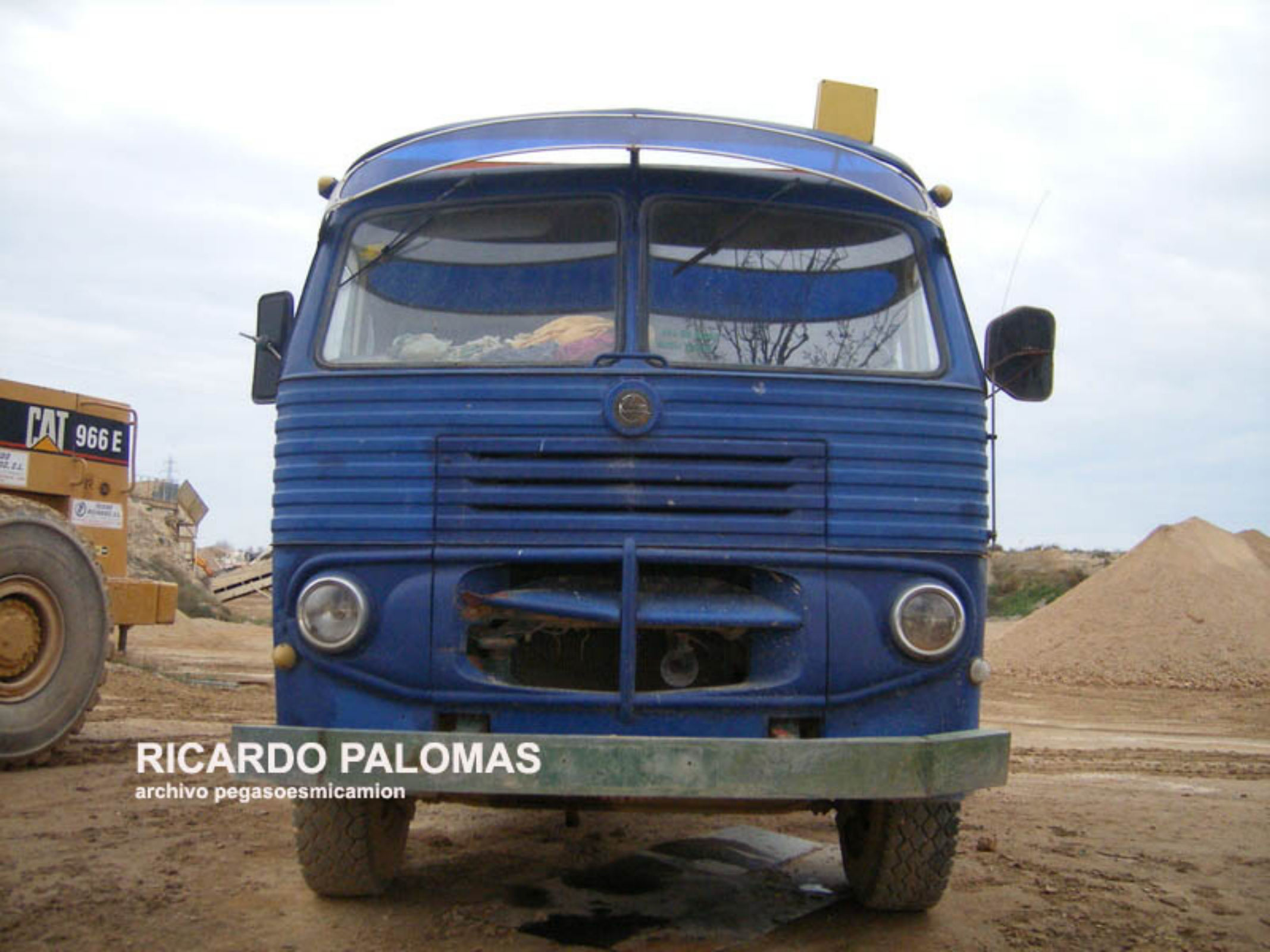
RICARDO PALOMAS archivo pegasoescamion