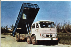
PEGASO 1.063 TRES EJES