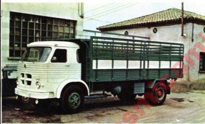
PEGASO EUROPA 1.065

Potencia de elevación . . . . . 22.000 kg Capacidad de carga . . . . . 11 m 3 Vuelco . . . . . 45°